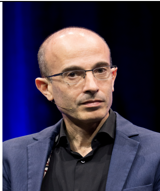
YUVAL N. HARARI

„Noi primim informații (gratuite) de la giganții din I.A. dar le plătim tot cu informații (despre noi!). A apărut ceva nou : Economia informațională.”