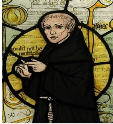
William de Occam